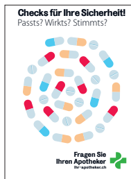
50x Flyer LOA A5