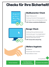
5x Zeigehilfe LOA